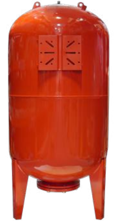
TABLA DE ESPECIFICACIONES