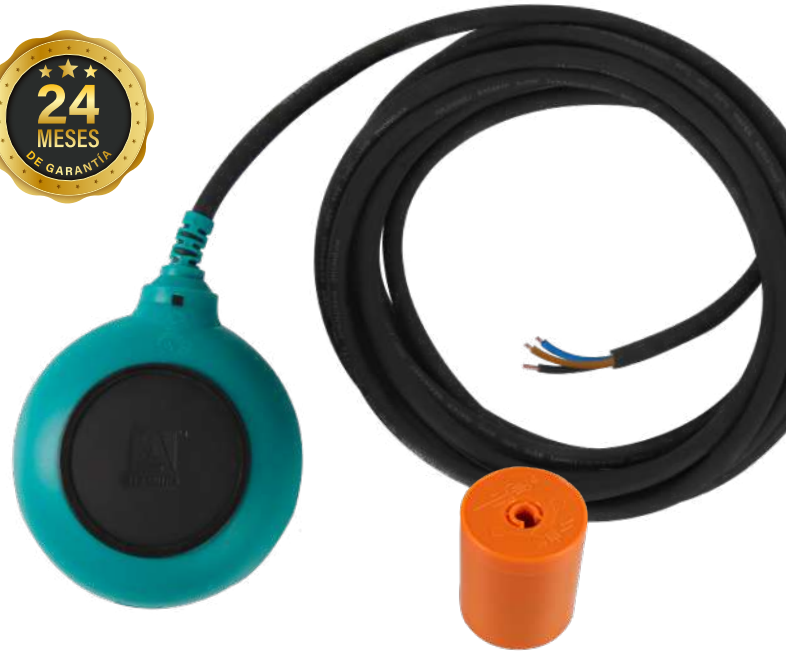
TABLA DE ESPECIFICACIONES